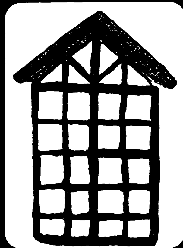
Vindu i Eid kyrkje